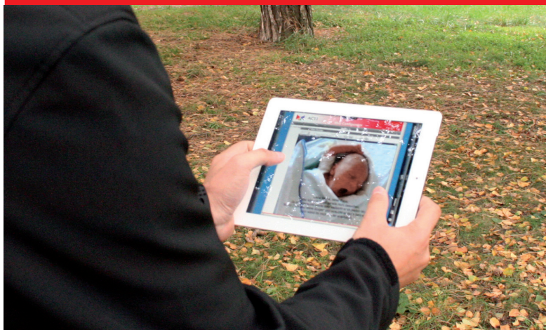
Kuscheblick via Tablet (weltweit anwählbar)