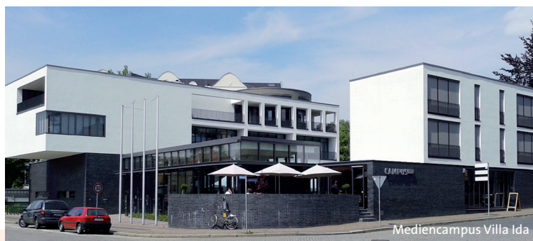
Medien-campus Villa Ida