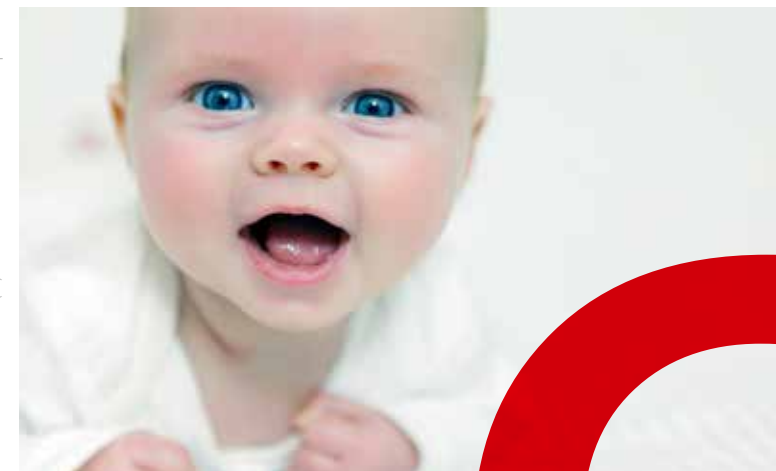
Abb.: © S1. (u.) Fotolia: 95186247-Subscription-Monthly-XXL

07.10. – 08.10.2022 Klinikum St. Georg gGmbH Delitzscher Str. 141 | 04129 Leipzig