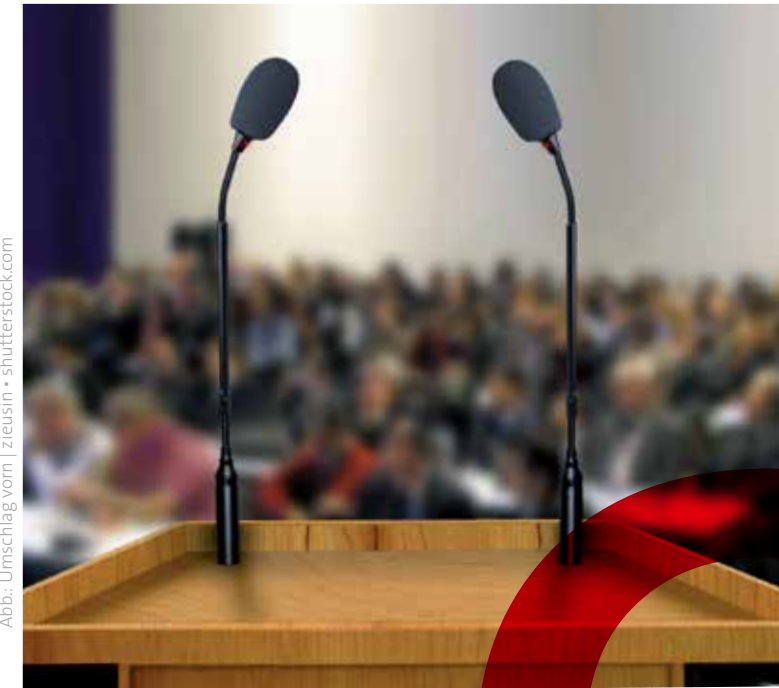
Abb.: Umschlag vorn

02.03.2024 | 08:30 Uhr Salles de Pologne Hainstr. 16 | 04109 Leipzig www.sanktgeorg.de